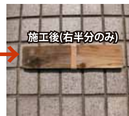
施工後(右半分のみ)