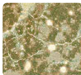
電子顕微鏡観察画像 施工前は毛細管と隙間だらけ

①劣化コンクリートの改質強化・緻密化、②塗膜の付着向上用のプライマーとしても最適、③ALCの防水、④クラック抑制、⑤素地によっては50mm以上浸透します。⑥中性化したコンクリートをアルカリ性改善します。